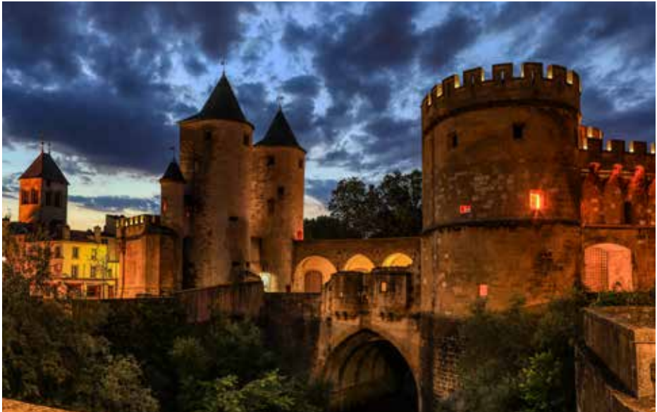
Porte des Allemands