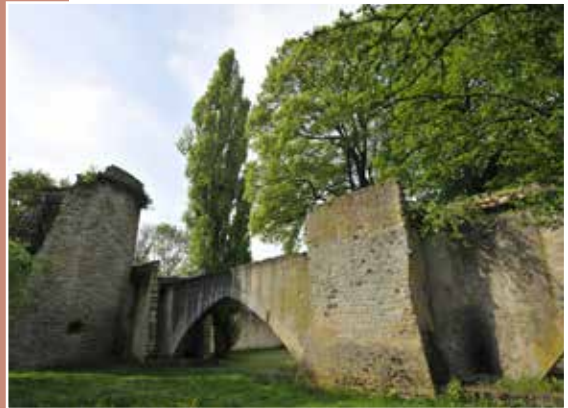
Circuit des remparts

Circuit allant du Pont des Grilles jusqu'à la Porte des Allemands. Il permet de découvrir les remparts du 13 ème et 15 ème siècle, et côté rive droite de la Seille, on peut admirer les remparts du 17 ème siècle. On accède également par ce circuit au Fort de Bellecroix où l'on découvre les fortifications de la ville du 18 ème et 19 ème siècle.