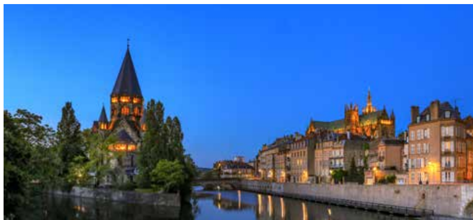
Temple Neuf, Cathédrale Saint-Étienne et Moselle