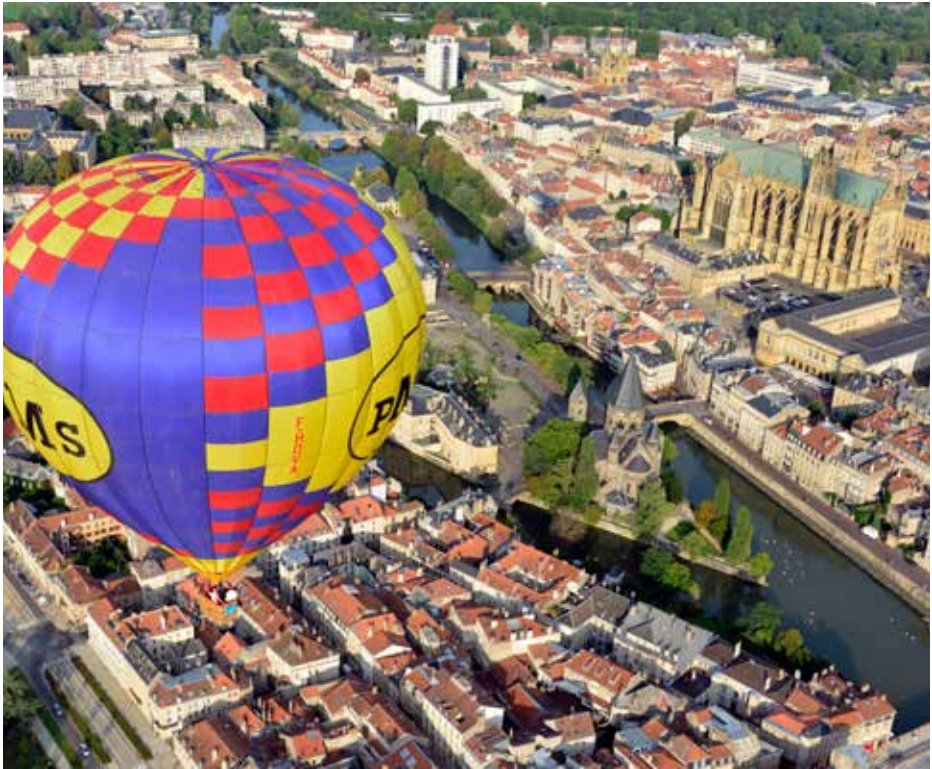
Montgolfiades - plan d'eau