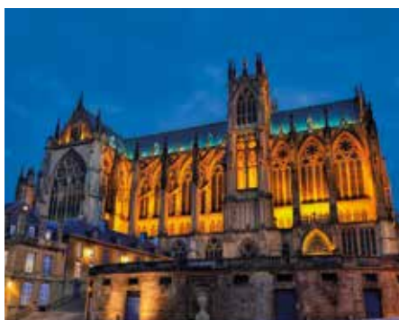
Cathédrale Saint-Étienne de Metz