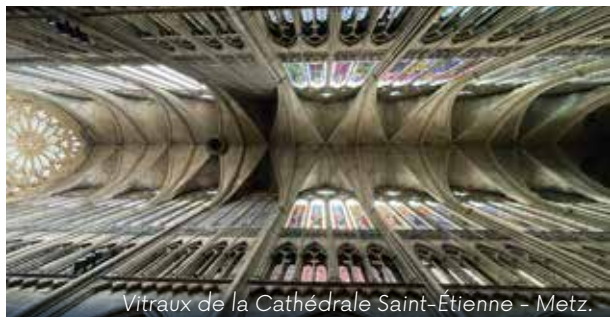
Vitreaux de la Cathédrale Saint-Étienne - Metz.