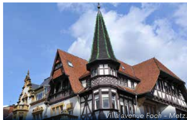
Villa avenue Foch - Metz.