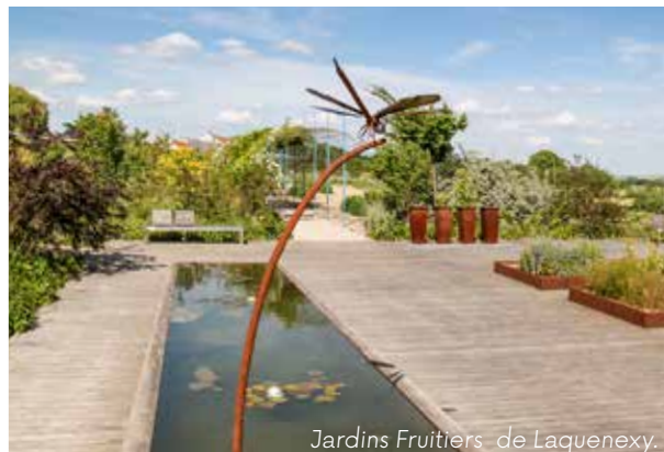
Jardins Fruitiers de Laquenexy.

Envie d'évasion, de nature, de découvertes et de quiétude ? Les Jardins Fruitiers de Laquenexy sont une ressource inestimable dans le cœur des amoureux de jardins. Amateurs et curieux peuvent découvrir au cours de la promenade, une vingtaine d'espaces thématiques disséminés au milieu des arbres fruitiers qui composent le verger.