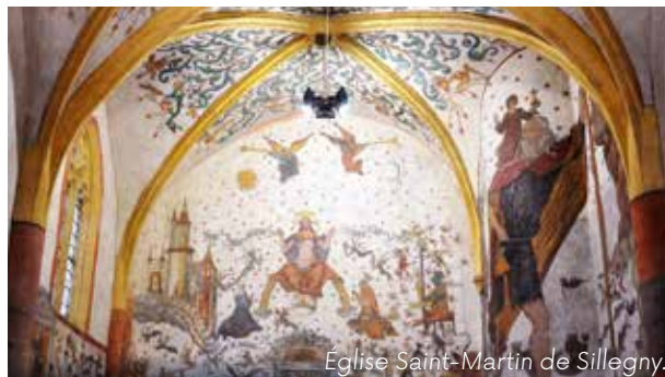
Eglise Saint-Martin de Sillegny.