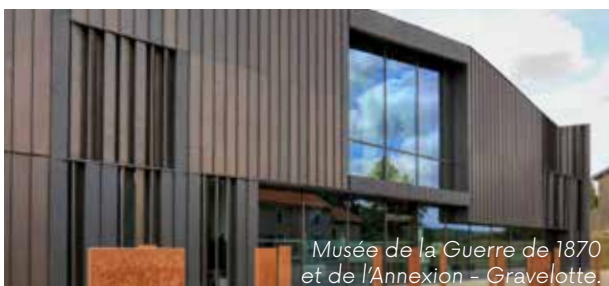
Musée de la Guerre de 1870 et de l'Annexion - Gravelotte.

Sur les lieux des combats, ce musée est le seul à se consacrer à l'histoire de la guerre de 1870, de son impact sur le territoire et de la vie quotidienne pendant l'annexion.