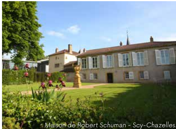
Maison de Robert Schuman - Scy-Chazelles.

Entrez dans l'intimité de Robert Schuman en visitant sa maison, une demeure lorraine typique des années 1950. Découvrez également le tout nouvel espace muséographique sur l'histoire de la construction européenne. Enfin, laissez-vous tenter par une promenade au milieu des fleurs du Jardin des Plantes de chez Nous.