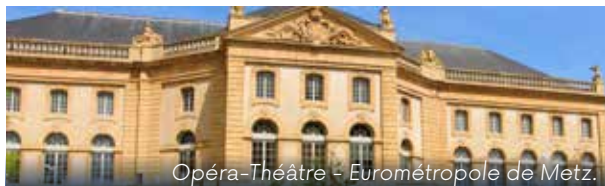
Opéra-Théâtre - Eurométropole de Metz.