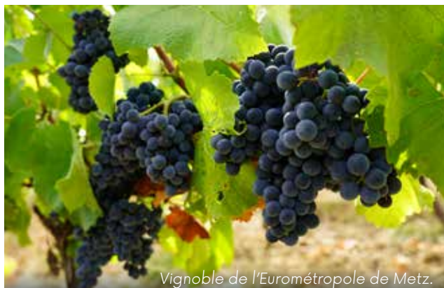
Vignoble de l'Eurométropole de Metz.