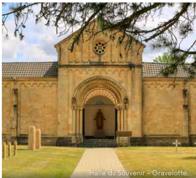
Halle du Souvenir - Gravelotte.

*L'abus d'alcool est dangereux pour la santé. À consommer avec modération.