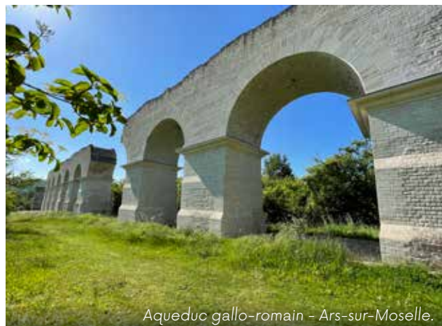
Aqueduc gallo-romain - Ars-sur-Moselle.