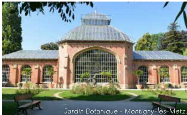
Jardin Botanique - Montigny-lès-Metz.