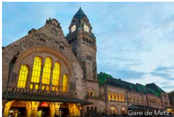
Gare de Metz.