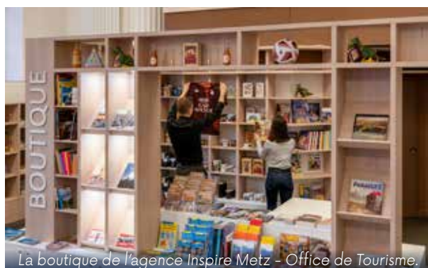
La boutique de l'agence Inspire Metz - Office de Tourisme.