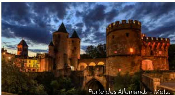
Porte des Allemands - Metz.