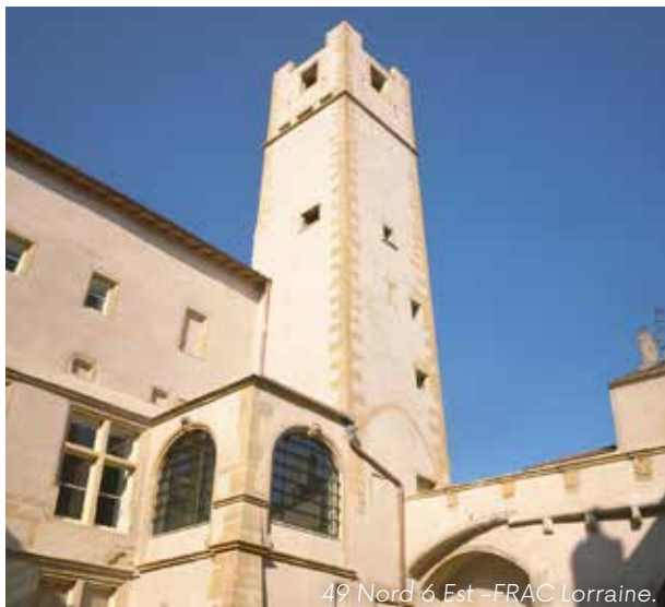
49 Nord 6 Est - FRAC Lorraine.

Espace d'exposition, le 49 Nord 6 Est - Frac Lorraine propose également des débats, conférences, projections de film, concerts ou encore performances. Sa collection de plus de 1 800 œuvres est attentive à la place accordée aux femmes dans l'écosystème artistique. Il est installé dans le plus ancien hôtel particulier de Metz, l'hôtel Saint-Livier, édifice civil du XII e siècle.