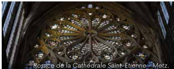
Rosace de la Cathédrale Saint-Etienne - Metz.

► Art de la lumière par excellence, le vitrail est partout présent dans les édifices religieux messins. Le circuit propose une découverte de vitraux de la période médiévale aux créations contemporaines, notamment les vitraux de la cathédrale Saint-Étienne et ceux dessinés par Jean Cocteau à l'église Saint-Maximin.