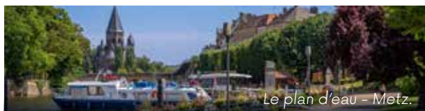
Le plan d'eau - Metz.