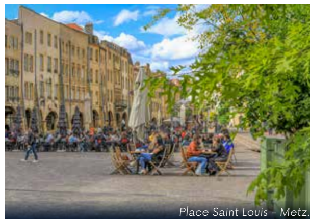
Place Saint Louis - Metz.