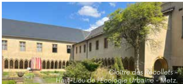
Cloître des Récollets - Haut-Lieu de l'Écologie Urbaine - Metz.

► En plein cœur de ville, sur la colline Sainte-Croix, se trouvent le jardin des Tanneurs, d'inspiration méditerranéenne, et le splendide cloître des Récollets (XIII e siècle), qui abrite aujourd'hui l'Institut Européen d'Écologie et les Archives municipales, ainsi qu'un jardin des Simples pour découvrir ou redécouvrir les plantes aux vertus médicinales. Le vaste jardin à la française de l'Esplanade, dans le quartier de l'ancienne citadelle, dévoile sa statuaire élégante et ses jets d'eau harmonieux à deux pas des rues commerçantes de la cité.