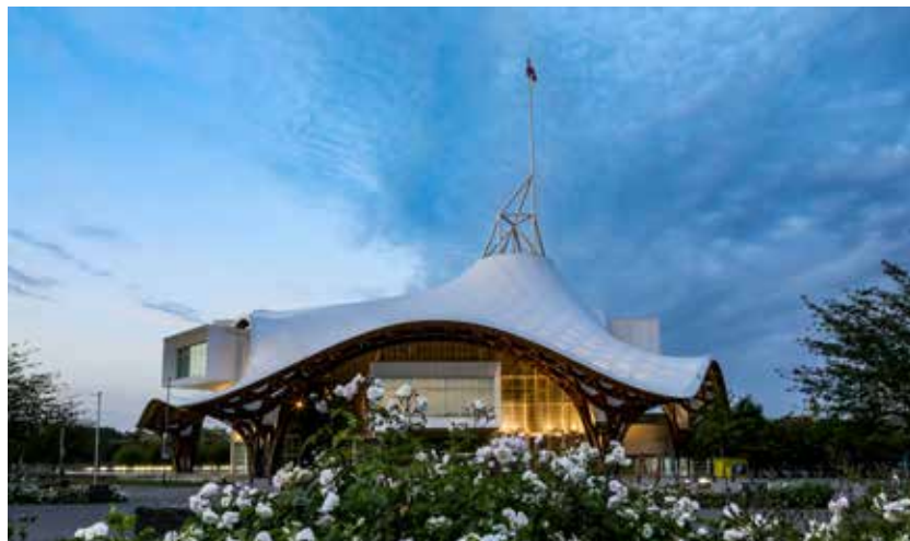
Shigeru Ban Architects Europe et Jean de Gastines Architectes, avec Philip Gumuchdjian pour la conception du projet lauréat du concours / Metz Métropole / Centre Pompidou-Metz / Photo Studio Hussenot.