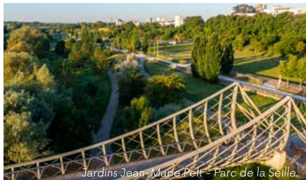
Jardins Jean-Marie Pelt - Parc de la Seille.

► Metz est une ville jardin ! Découvrez ses jardins, tous différents, avec leur identité propre, leur histoire, leurs aménagements spécifiques, des plus visibles aux plus secrets... Des trésors de nature pour le bien-être des citoyens.