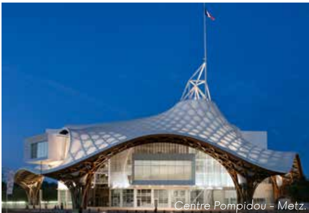
Centre Pompidou - Metz.