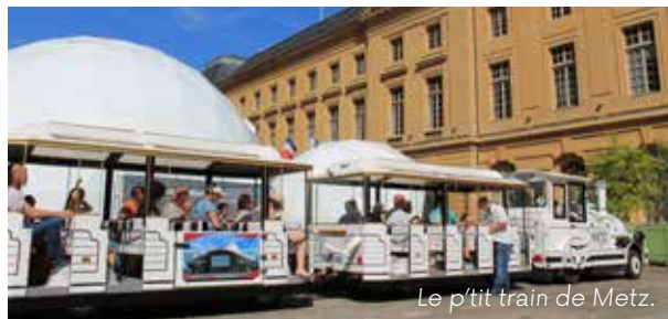
Le p'tit train de Metz.