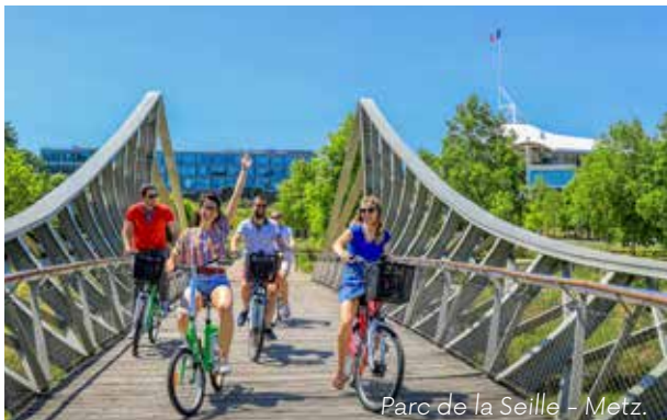
Parc de la Seille - Metz.