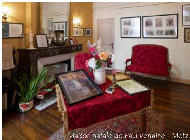
Maison natale de Paul Verlaine - Metz.