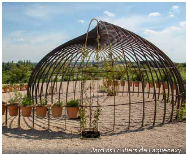
Jardins Fruitiers de Laquenexy.