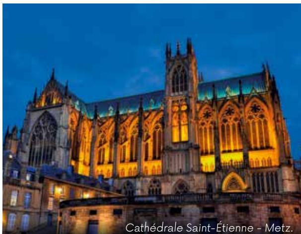
Cathédrale Saint-Étienne - Metz.