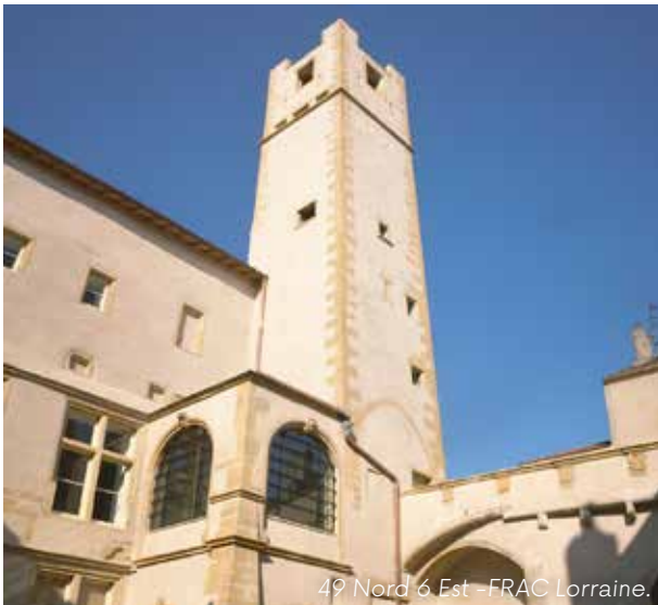
49 Nord 6 Est - FRAC Lorraine.

Im Ausstellungsraum 49 Nord 6 Est - FRAC Lorraine finden auch Diskussionen, Vorträge, Filmvorführungen, Konzerte oder Art Performances statt. Die Sammlung von über 1 600 Werken richtet ihre Aufmerksamkeit auf die Stellung der Frau im künstlerischen Ökosystem. Sie befindet sich in einem der ältesten Privathäuser von Metz, dem Hôtel Saint-Livier, einem bürgerlichen Gebäude aus dem zwölften Jahrhundert. Kostenloser Besuch der Ausstellungen jeweils sonntags um 16.00 Uhr. In Gebärdensprache übersetzt: an einem Sonntag im Monat um 15.00 Uhr (auf Reservierung mindestens 10 Tage im Voraus. Termine finden Sie auf der Webseite).