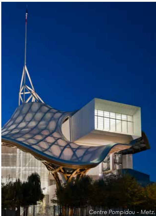
Centre Pompidou - Metz.