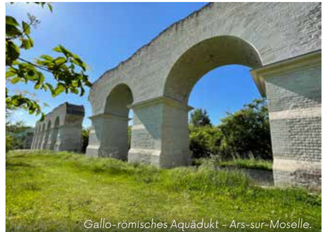
Gallo-römisches Aquädukt - Ars-sur-Moselle.