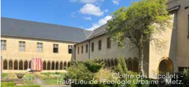
Cloître des Récollets - Haut-Lieu de l'Écologie Urbaine - Metz.

► Im Herzen der Stadt, auf dem Hügel Sainte-Croix, liegt der mediterran angelegte Garten der Gerber (Jardin des Tanneurs) und das prachtvolle Kloster Cloître des Récollets aus dem 13. Jahrhundert, in dem sich heute das Europäische Institut für Ökologie und das Stadtarchiv befindet. Im Heilpflanzengarten entdeckt der Besucher vergessene Kräuter mit medizinischen Wirkungen. Der große französische Garten der Esplanade im Viertel der alten Zitadelle bietet elegante Skulpturen und ästhetische Wasserspiele einen Katzensprung von den Einkaufsmeilen der City entfernt. Optional: Mit Ihrem Bus setzen Sie Ihren Besuch im Botanischen Garten fort, der 1866 als Parklandschaft auf 4,4 Hektar angelegt wurde.