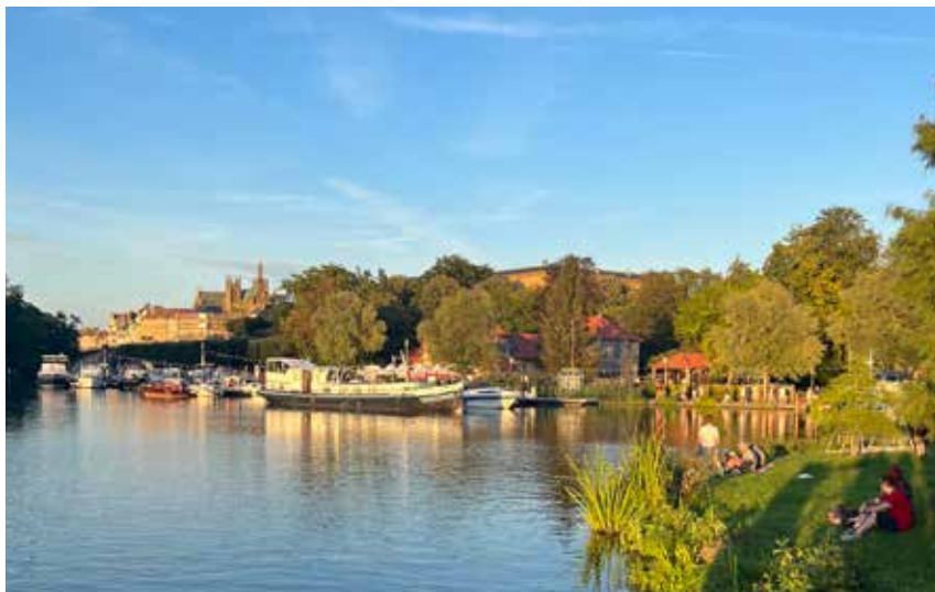
▲ Plan d'eau - Metz.

Fußgängerwege und viele Radwege führen zu Erkundungstouren in Naturschutzgebiete wie den Mont Saint-Quentin und malerische Dörfer.