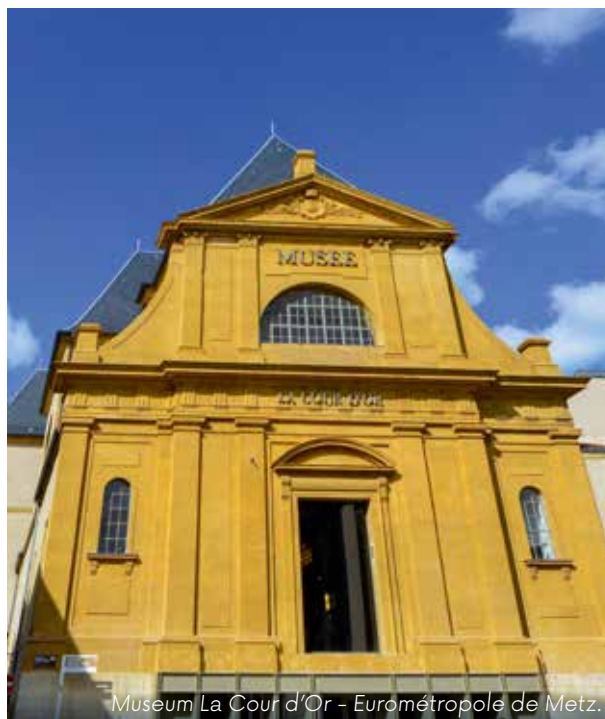
Museum La Cour d'Or - Eurométropole de Metz.