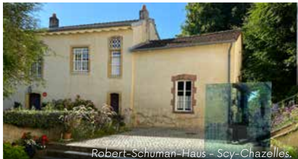
Robert-Schuman-Haus - Scy-Chazelles.