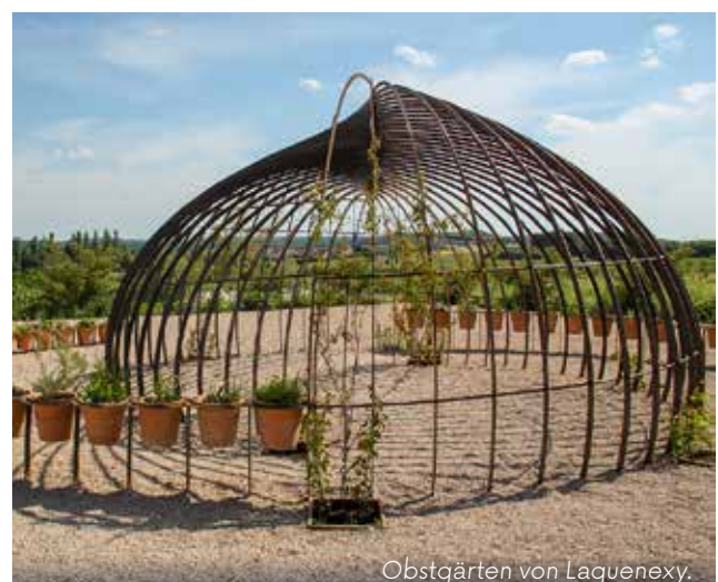
Obstgärten von Laquenexy.