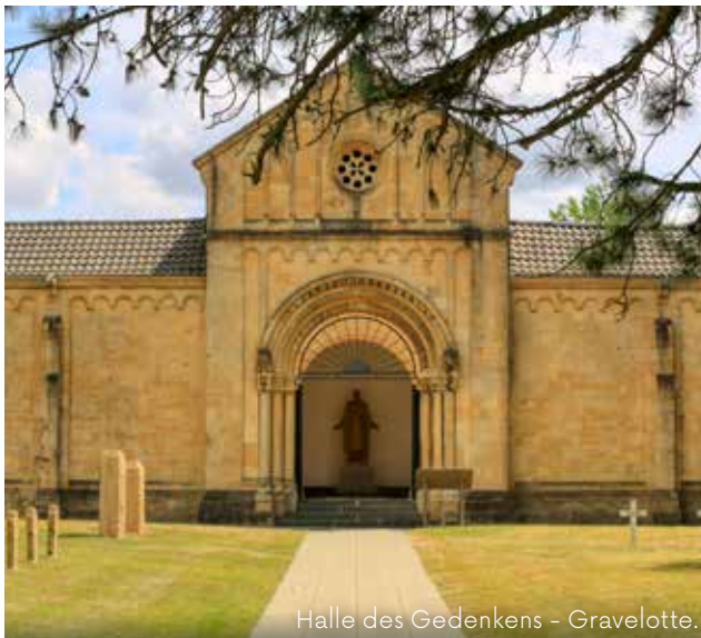
Halle des Gedenkens - Gravelotte.