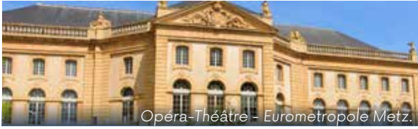
Opéra-Théâtre - Eurometropole Metz.