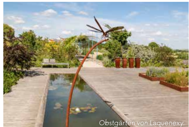
Obstgärten von Laquenexy.

Lust auf Entspannung, Natur, Entdeckungen und Ruhe? Die Obstgärten von Laquenexy sind eine unschätzbare Quelle der Freude für Gartenliebhaber. Während eines Spaziergangs können sowohl Liebhaber als auch Neugierige etwa zwanzig thematische Bereiche entdecken, die zwischen den Obstbäumen des Obstgartens verteilt sind.