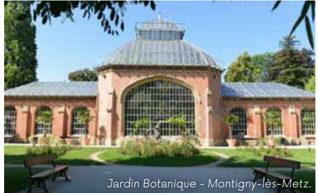
Jardin Botanique - Montigny-lès-Metz.