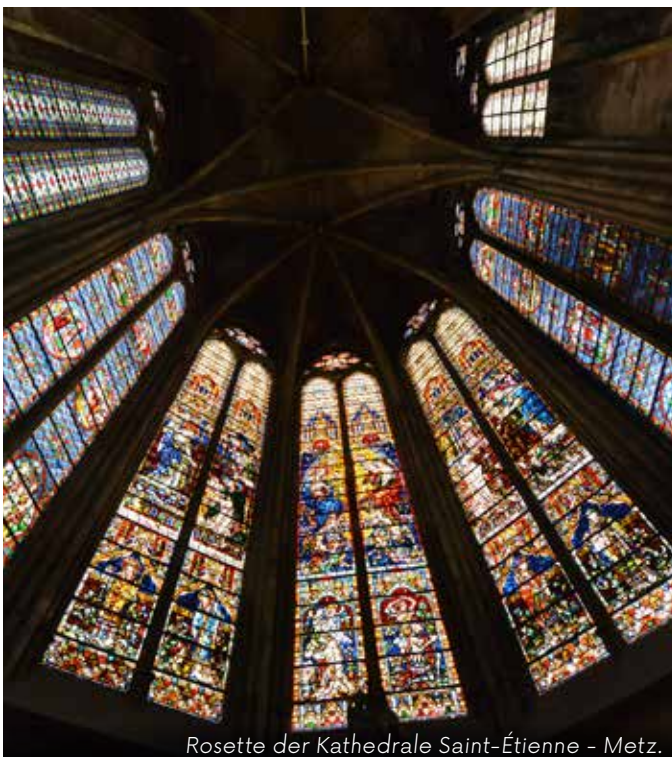
Rosette der Kathedrale Saint-Étienne - Metz.