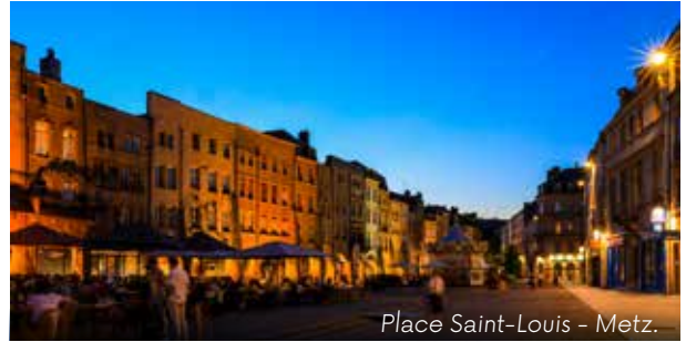
Place Saint-Louis - Metz.