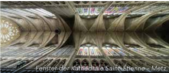
Fenster der Kathedrale Saint-Étienne - Metz.