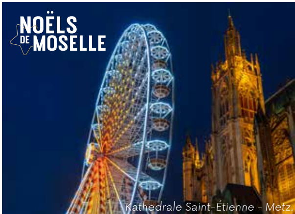
Kathedrale Saint-Étienne - Metz.