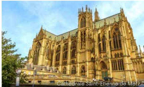
Cathédrale Saint-Étienne de Metz.