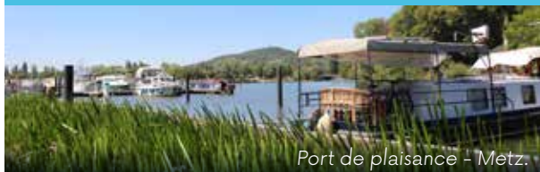
Port de plaisance - Metz.

* Alkoholmissbrauch gefährdet die Gesundheit. Alkoholische Getränke deshalb maßvoll konsumieren.