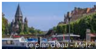
Le plan d'eau - Metz.