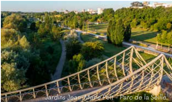
Jardins Jean-Marie Pelt - Parc de la Seille.

► Metz ist eine Gartenstadt! Entdecken Sie seine Gärten, die sich in ihrer eigenen Identität, ihrer Geschichte, ihrer spezifischen Anlage unterscheiden, ob unübersehbar oder Geheimtipp: Es sind Naturschätze zum Wohle der Stadtbewohner. Optional: Schiffsausflug auf der Mosel.