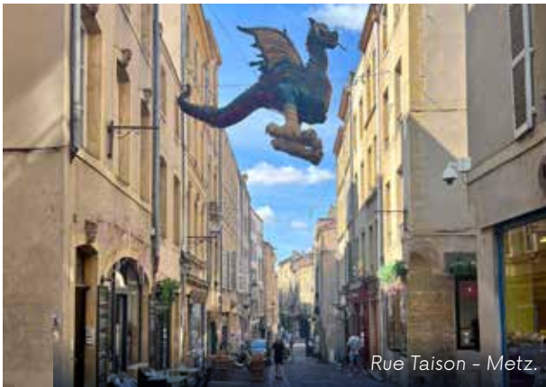
Rue Taison - Metz.

Für die Größeren bieten die einstündigen Stadtbesichtigungen mit Erklärungen: