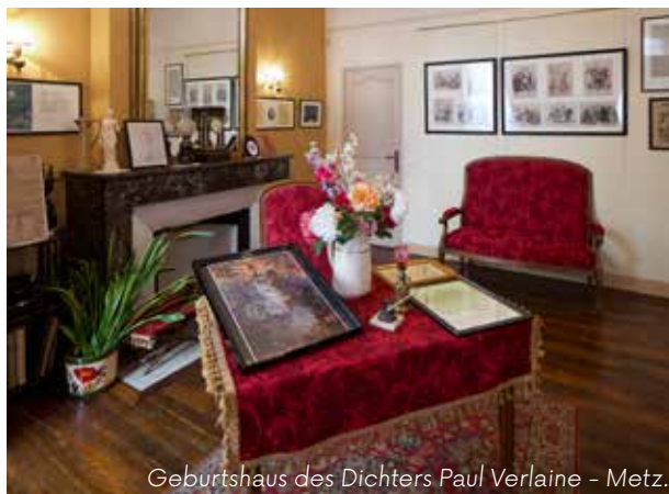
Geburtshaus des Dichters Paul Verlaine - Metz.