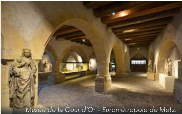
Musée de la Cour d'Or - Eurométropole de Metz.