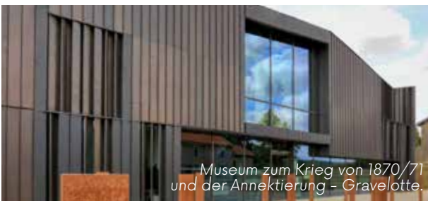
Museum zum Krieg von 1870/71 und der Annektierung - Gravelotte.

Dieses Museum auf dem ehemaligen Schlachtfeld widmet sich als einziges Ausstellungshaus dem Krieg von 1870/71, den Auswirkungen auf die Region und dem Alltag während der Annektierung.