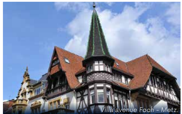
Villa avenue Foch - Metz.