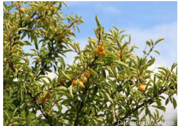
Distillerie de Mélanie.

► Gärten und Sehenswürdigkeiten: die Obstgärten von Laquenexy oder das Robert-Schuman-Haus und der botanische Garten einheimischer Pflanzen „Jardin des Plantes de chez nous“.