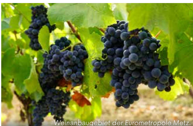
Weinanbaugebiet der Eurometropole Metz.