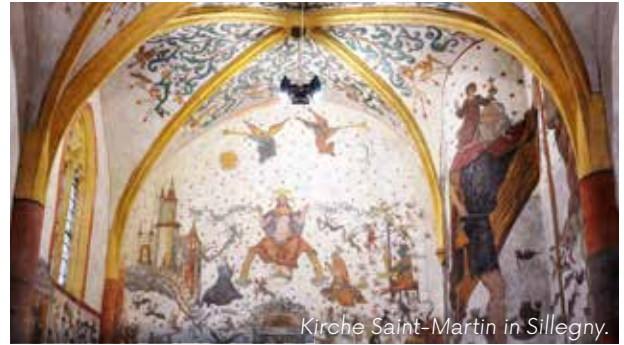
Kirche Saint-Martin in Sillegny.

► Im Umland von Metz zeugen Sehenswürdigkeiten von einer reichen und wechselvollen Geschichte: die Kirche von Sillegny (Fresken aus dem 16. Jahrhundert), die befestigten Kirchen der Republik Metz und mehr.