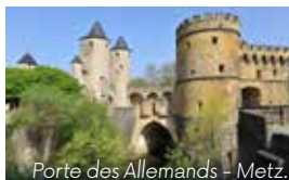
Porte des Allemands - Metz.