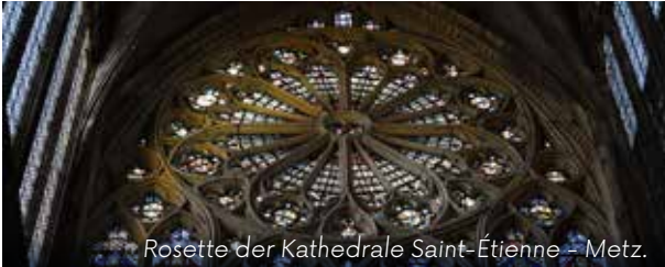
Rosette der Kathedrale Saint-Étienne – Metz.

► In den Sakralbauten von Metz ist die Glaskunst – Lichtkunst par excellence – überall präsent. Die Besichtigungstour bietet eine Fensterschau vom Mittelalter bis zu zeitgenössischen Kreationen, insbesondere die Fenster der Kathedrale Saint-Étienne und die von Jean Cocteau entworfenen Fenster der Kirche Saint-Maximin.