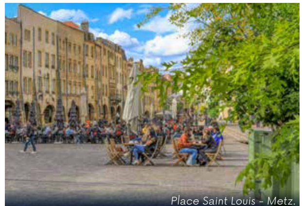
Place Saint Louis - Metz.