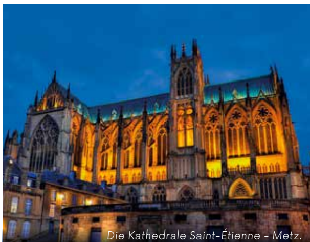
Die Kathedrale Saint-Étienne - Metz.