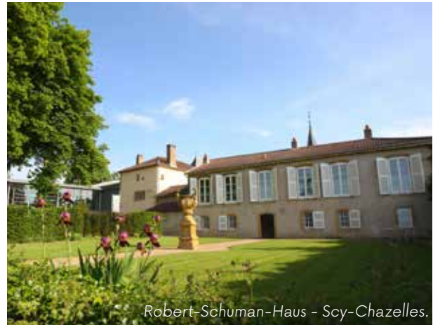
Robert-Schuman-Haus - Scy-Chazelles.

Tauchen Sie ein in das Privatleben von Robert Schuman und besuchen Sie sein Haus, ein typisch lothringisches Wohngebäude aus den 1950er Jahren. Entdecken Sie auch den brandneuen Ausstellungsbereich zur Geschichte des europäischen Aufbaus.. Genießen Sie zum Abschluss einen Streifzug durch die Blumen des botanischen Gartens einheimischer Pflanzen «Jardin des Plantes de chez Nous».