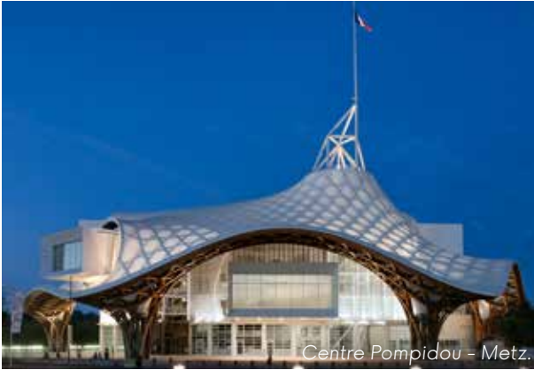
Centre Pompidou - Metz.